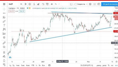
Рис. 2. График акций «Газпром».

Аналитическая платформа, ориентированная на американский рынок. Кроме акций, здесь можно найти информацию по фьючерсам, валютным парам и криптовалюте. Большой популярностью у трейдеров и инвесторов пользуется скринер на Finviz со множеством фильтров. Благодаря этому инструменту можно найти самые привлекательные по фундаментальным показателям активы.