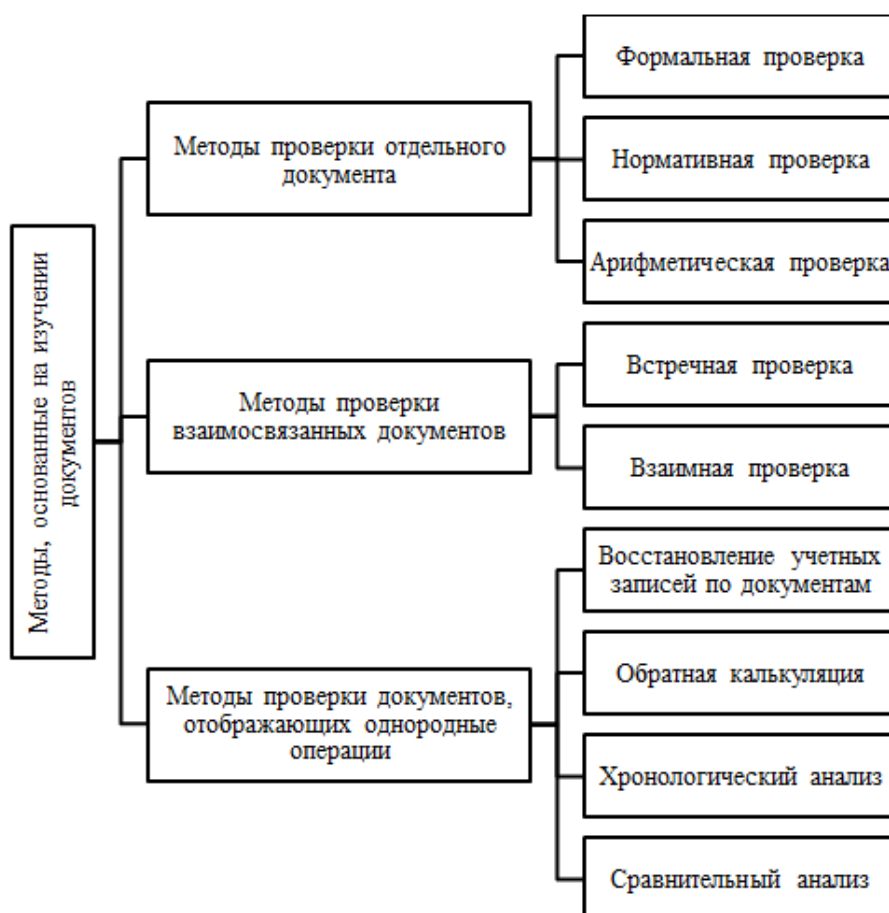
Рисунок 1. Методы, основанные на изучении документов [2, с. 378]

встречная); методы проверки документов, которые отображают однородные операции (сравнительный, хронологический анализ). Методы, которые основаны на изучении документов, представлены на рисунке 1.